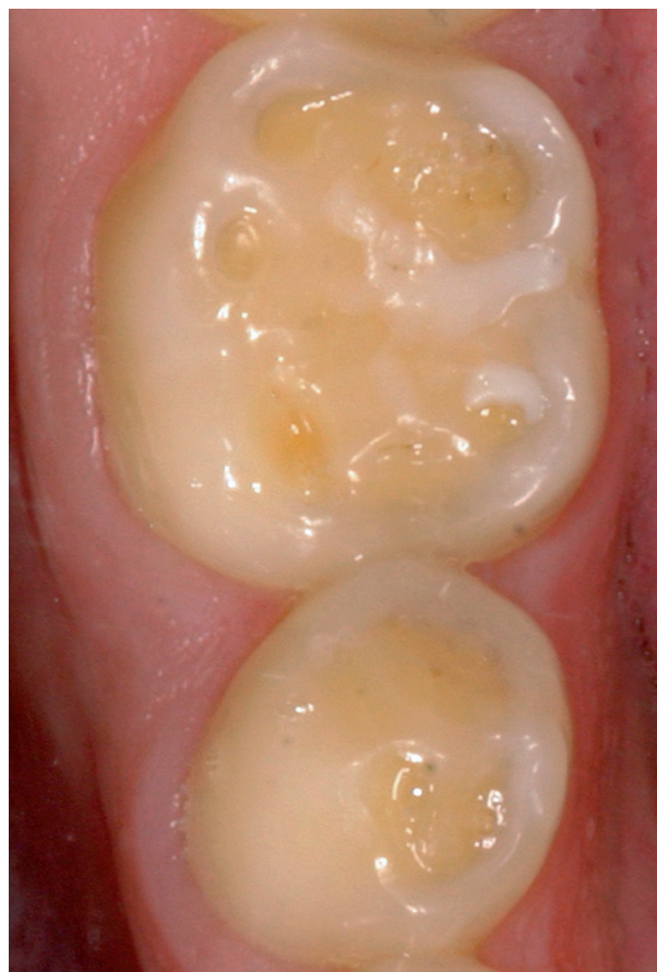
Erosion auf der Kaufläche des zweiten kleinen und des ersten großen Backzahnes.

Nur wenn Ihre Mundhygiene nicht ausreichend ist, die Zahndefekte sehr schnell zunehmen oder Sie so stark bürsten, dass Sie Ihren Zähnen schaden, sollten Sie Ihre Mundhygienegewohnheiten ändern. Ihre Zahnärztin oder Ihr Zahnarzt kann Sie beraten und Ihnen sagen, ob das der Fall ist. Behalten Sie sonst Ihre Mundhygiene wie gewohnt bei.