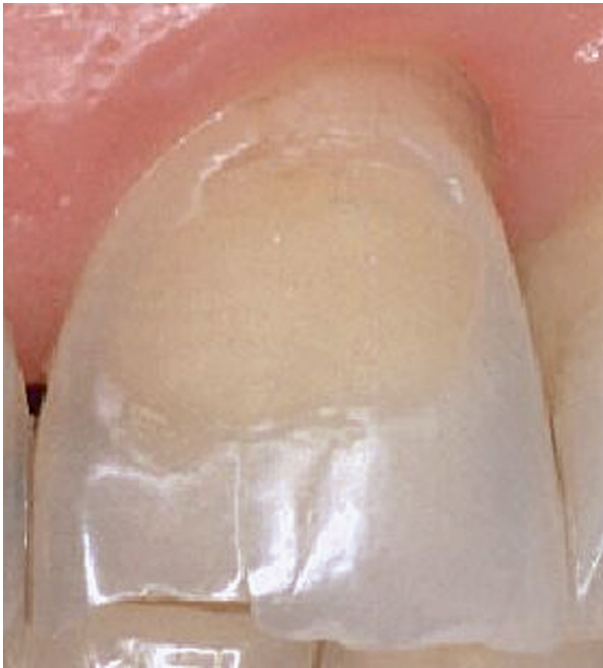
Klassische Erosion an der Außenfläche des oberen linken Schneidezahns. Typisch sind die Muldenform und der intakte Zahnschmelz am Zahnfleischrand.

Erosionen sind Zahnschäden, die durch den direkten Kontakt eines sauberen Zahnes mit Säuren entstehen. Die Säuren können Mineralien aus der Zahnoberfläche herauslösen, wodurch Zahnschmelz abgetragen wird und Defekte auf der Zahnoberfläche entstehen.