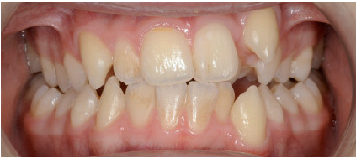
Missverhältnis zwischen Zahn- und Kiefergröße mit Eng- und Drehständen sowie Außenstand der beiden linken Eckzähne

■ Zahn- und Kieferfehlstellungen werden mit dem Ziel behoben eine optimale Kaufunktion zu erreichen. Im Zuge der Behandlung kann es notwendig sein, bleibende Zähne aus dem Zahnbogen zu entfernen. Dabei werden die Zahnstellung, das Platzangebot sowie das noch zu erwartende Wachstum der Kiefer mit berücksichtigt. Häufigster Grund für eine Zahntentfernung ist ein ausgeprägtes Missverhältnis zwischen der Zahngröße und der Kiefergröße. Ursache dafür ist ein zu kleiner Kiefer bei normalen oder zu großen Zähnen, woraus ein Platzmangel resultiert, dabei stehen die Zähne eng und verschachtelt und manchmal auch außerhalb der Zahnreihe. Die Entfernung von Zähnen ist dann unumgänglich, wenn alle anderen Maßnahmen zur Beschaffung von Platz nicht zum Ziel geführt haben. Ziel ist eine harmonische Ausformung beider Zahnbögen und eine korrekte Stellung der Kiefer zueinander Auch zum Ausgleich von nicht angelegten Zähnen, bei Asymmetrien oder zur Platzbeschaffung für verlagerte Zähne ist eine Extraktion häufig sinnvoll. Ob Zähne im Rahmen einer kieferorthopädischen Behandlung entfernt werden müssen, ergibt sich nach genauer Analyse der Behandlungsunterlagen (Kiefermodelle, Röntgenbilder, Fotos).